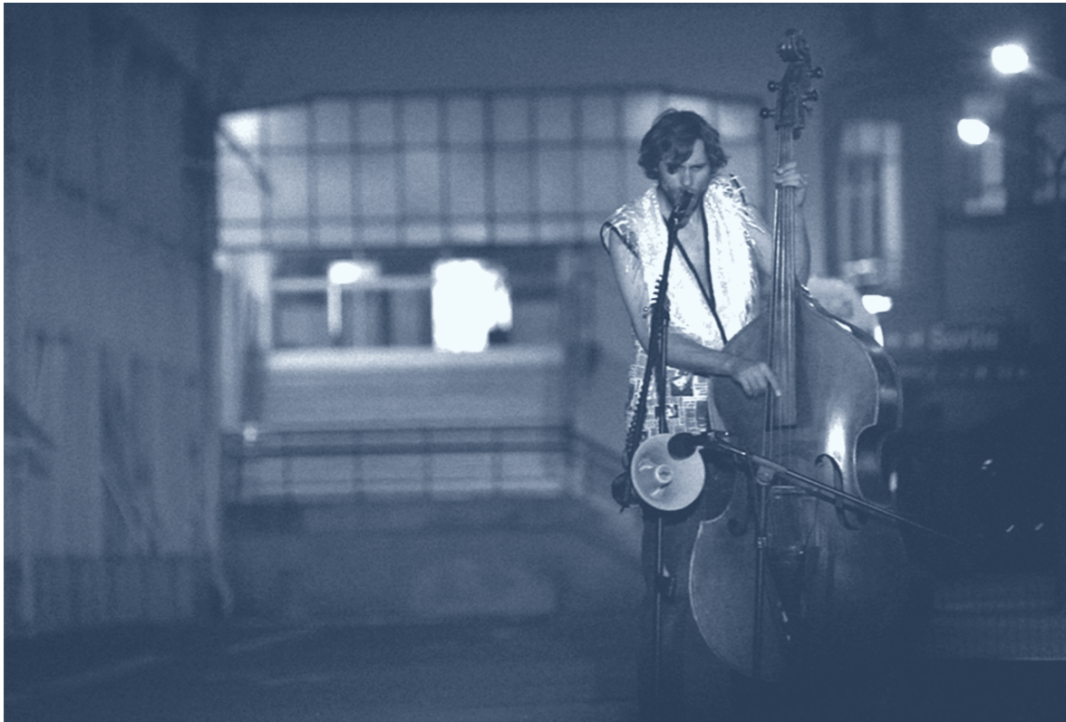
Asphalt Piloten «Dark Side of The Moon», 2013