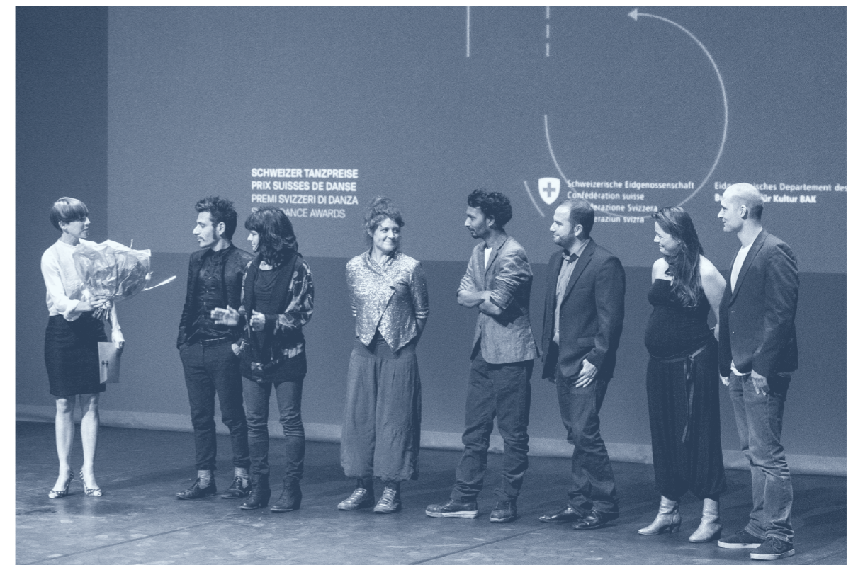
Oben: Performance der Asphalt Piloten vor dem Theater Équilibre in Fribourg anlässlich der Vergabe der Tanzpreise des BAK am 20.9.2013