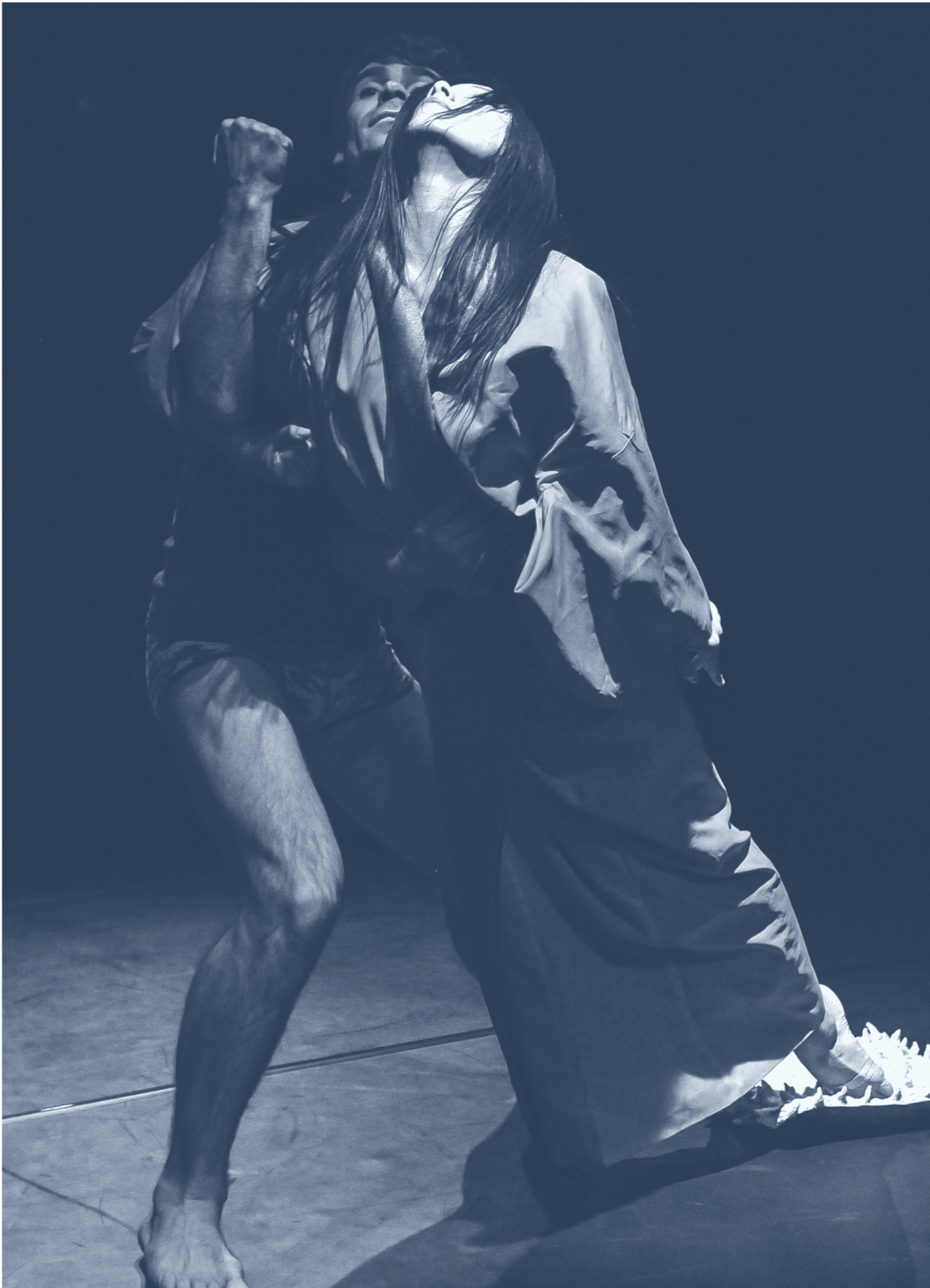
T42 «Another Chopstick Story», 2011 © Christian Glaus